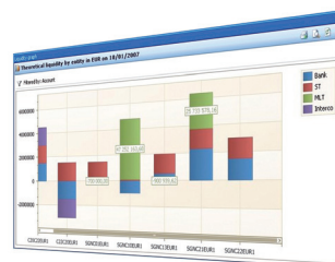
Position de la trésorerie nette