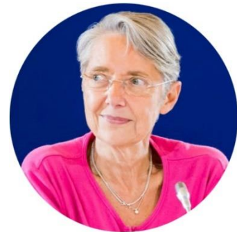
Élisabeth Borne, ministre de la Transition écologique et solidaire

Les perspectives sont vastes, créons les conditions pour qu'elles profitent à tous.