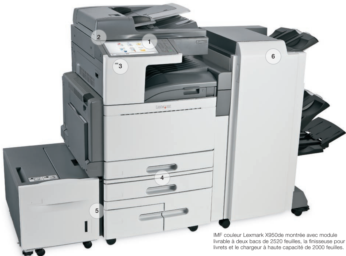
IMF couleur Lexmark X950de montrée avec module livrable à deux bacs de 2520 feuilles, la finisseuse pour livrets et le chargeur à haute capacité de 2000 feuilles.