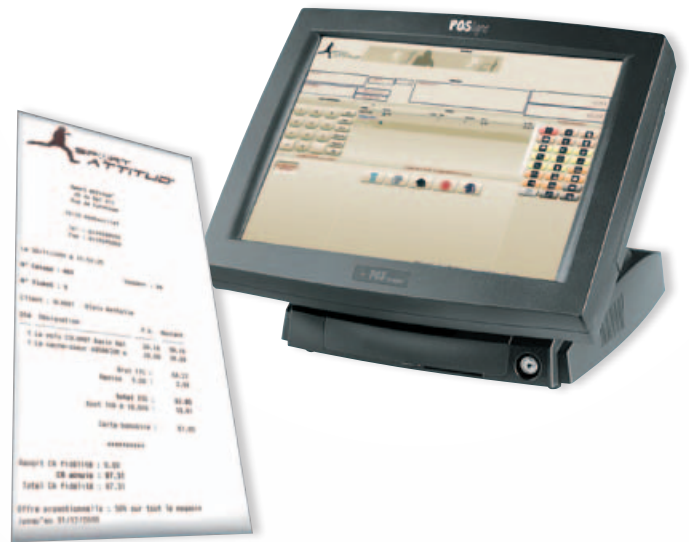
Personnalisez votre écran de vente et vos tickets de caisse