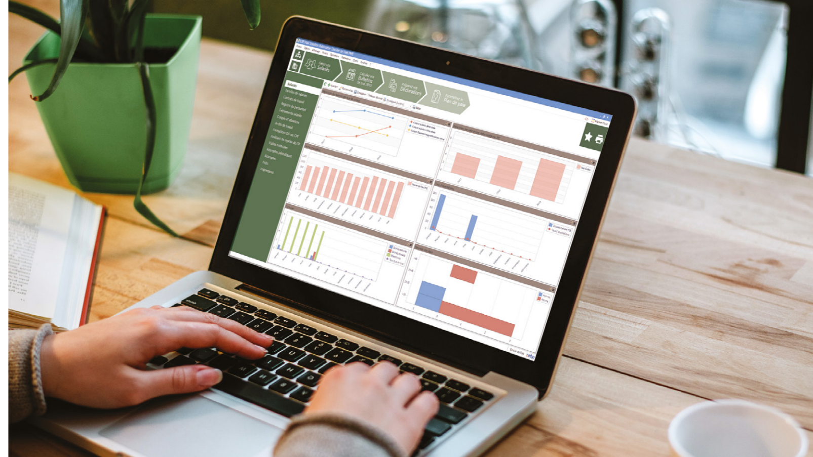
Suivez l'évolution de la masse salariale de vos clients à l'aide des tableaux de bord.