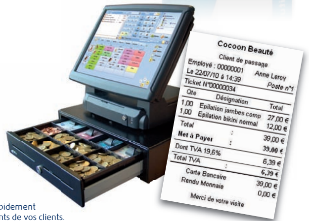
Encaissez rapidement les règlements de vos clients.